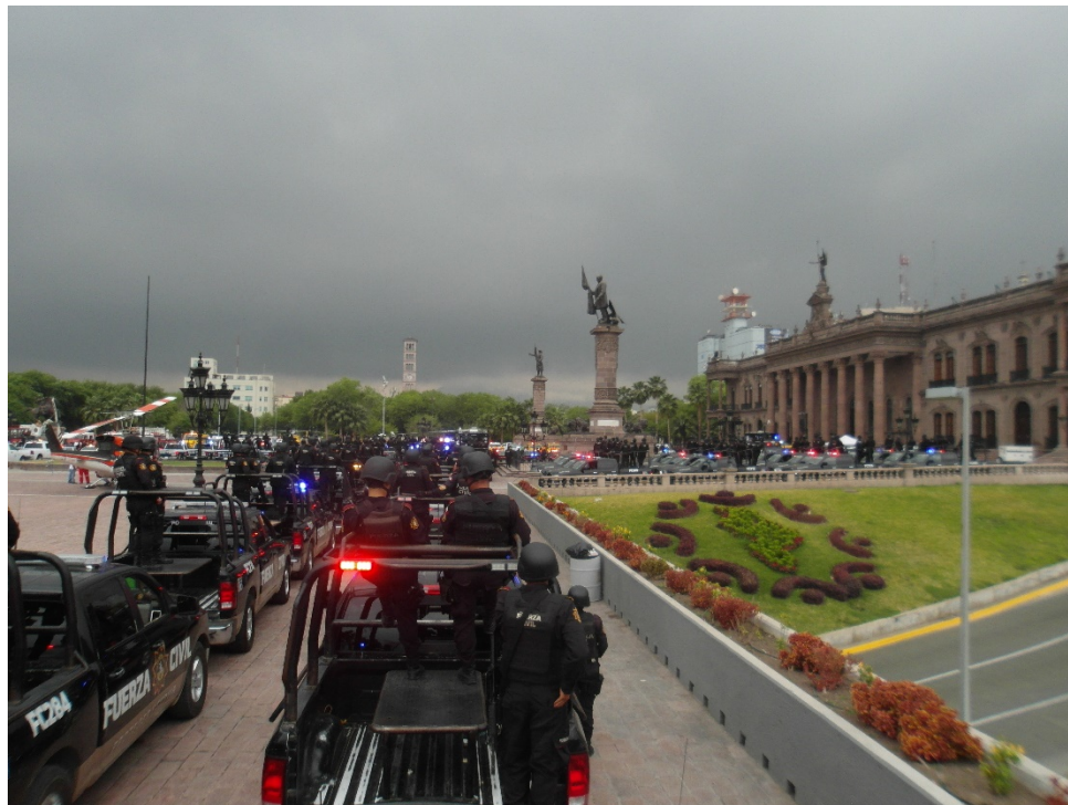
Figura 8.- Operativo semana santa.