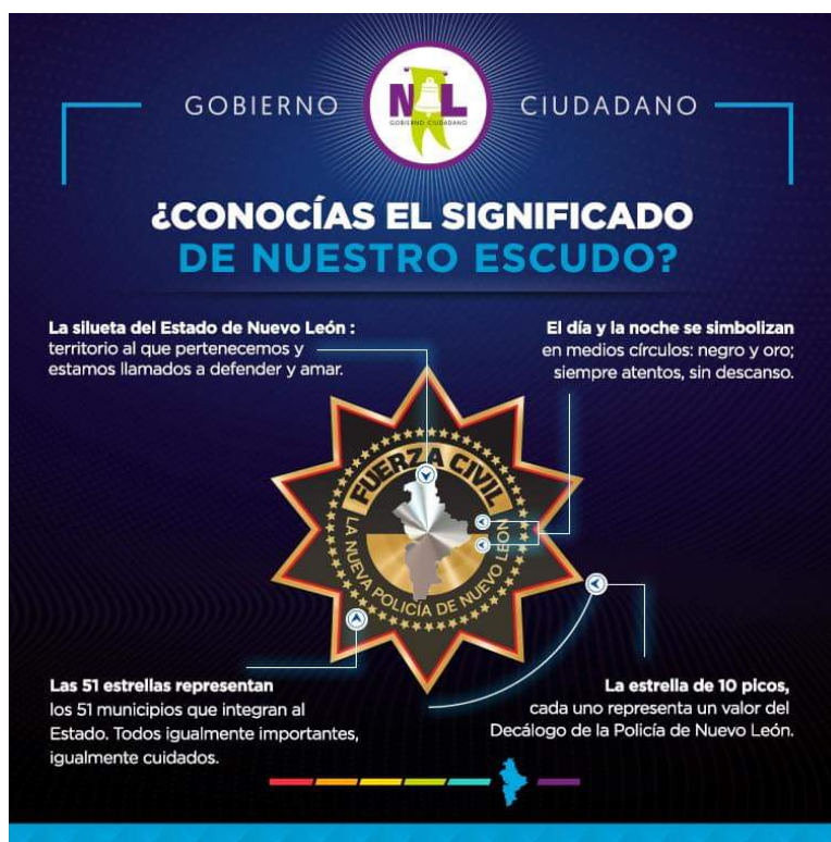
Figura 2. Escudo de la Policia Fuerza Civil.

noche que es la forma de representar que siempre se está atento al llamado de la ciudadanía.