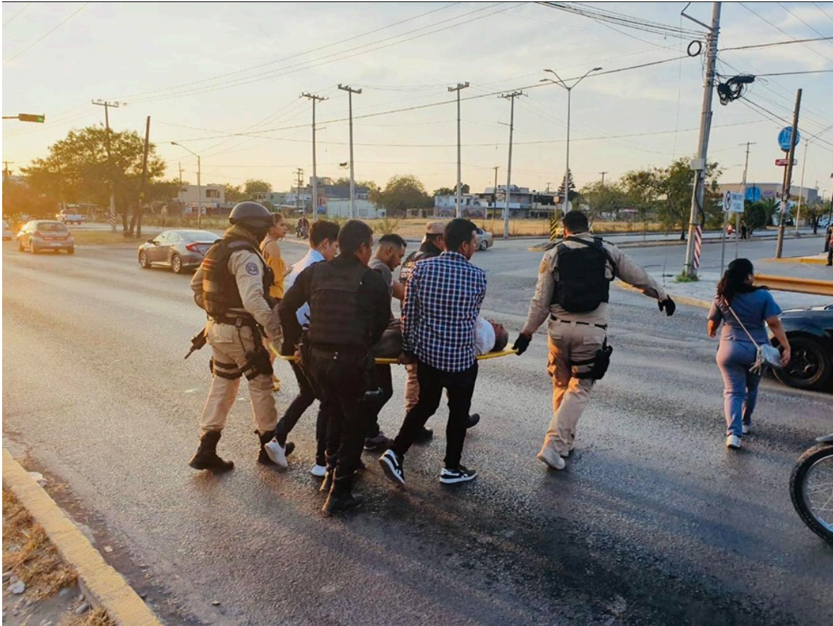
Figura 6.- Proteger y Servir a la ciudadanía.