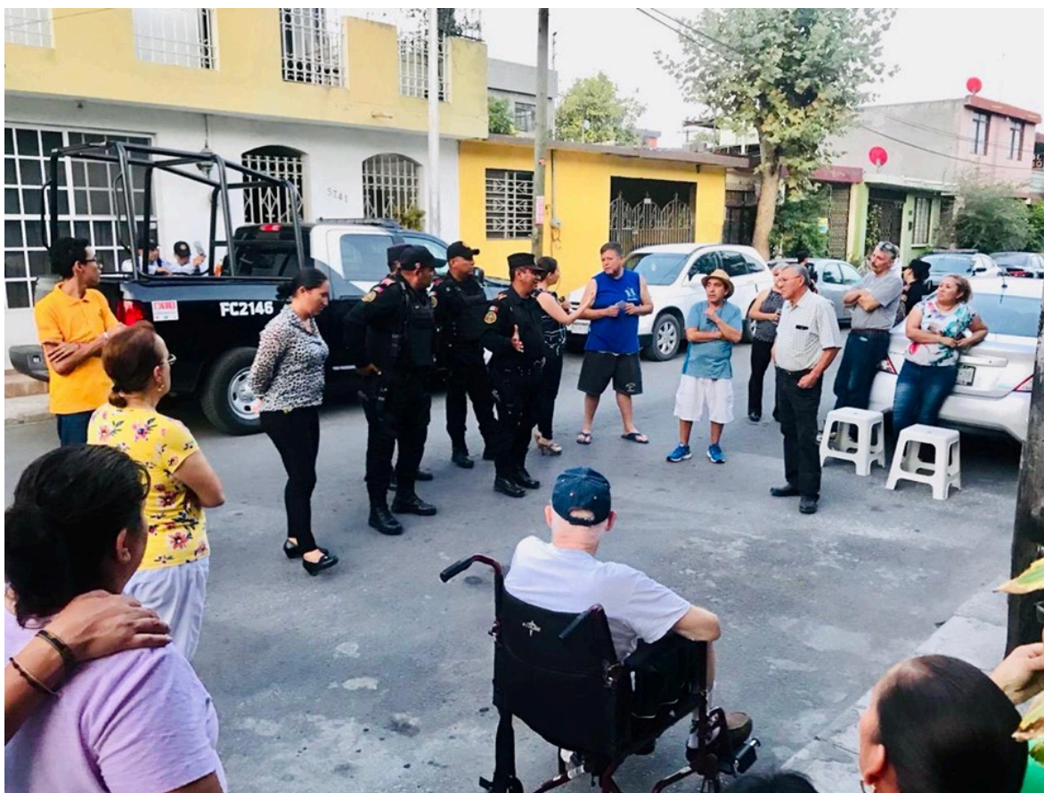
Figura 14.- Junta vecinal, Apodaca Nuevo León 2019.

primeramente ganando la aceptación y confianza de la misma ciudadanía mediante juntas vecinales, platicas escolares, vigilancia fija momentánea en lugares y horarios de mayor afluencia de personas, conviviendo con la sociedad como uno más de ellos con la diferencia de que nosotros estamos armados y uniformados; muchas técnicas se tienen que aplicar aquí, desde caminar en los “mercaditos” hasta (sin descuidar nuestra propia seguridad perimetral) desayunar, comer, o cenar en puestos de vía pública o tomándonos un descanso en la tienda de la esquina, entonces la información fluye.