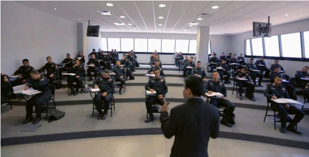
Figura 3.- Clases en la Universidad de Ciencias de la Seguridad.

para ambos debemos de estar preparados, ten presente que no toda la policia está en las calles, en los aeropuertos, persiguiendo a los grandes narcotraficantes o cuidando a los menores y mayores infractores de la ley; existimos también quienes hacemos esa parte de proximidad social, de inteligencia, de acercamiento humano con quienes muchas veces se mantienen en el anonimato pero que son los que más nos dan, las gentes de las comunidades alejadas del bullicio de la sociedad y que es de quienes más aprendemos, porque si, es cada servicio asignado, en cada labor de proximidad se aprende algo nuevo que nos ayuda a nuestro crecimiento profesional y personal.