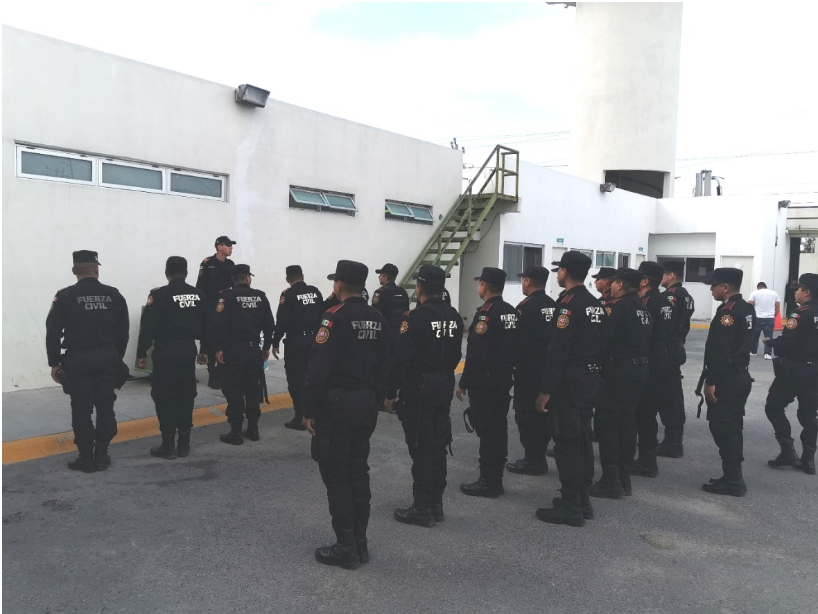
Figura 4.- Asignación de servicios.

Por otra parte este servicio nombrado es lo que la ley marca como primer respondiente ; al estar en operativo de calle, son y somos los encargados de atender las llamadas de emergencia (figura 5) que pueden ser de dos vertientes: por central de radio (911) y en flagrancia (denuncias anónimas in situ ); sea una o sea otra somos los responsables de arribar a la brevedad posible a la escena del reporte y es aquí donde una vez más recalco que debemos de tener la templanza, trato, delicadeza, tacto, profesionalismo y entereza para hacer lo correcto; tener bien arraigados el valor de la empatía sin dejar que nos sobre pase porque, en lo personal he tenido eventos de alto impacto (de los cuales no adentrare en ello porque no es tema central de este trabajo), es decir; eventos que por su propia naturaleza se requiere el apoyo de otras ciencias y equipos especiales, y que son en donde realmente se ponen en juego según lo redactado hasta este punto los valores y la moral, porque: ¿Cómo respetar los derechos y la propia vida de