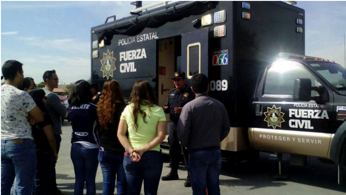
Figura 16.- Interactuando con los universitarios; Montemorelos 2016.

Entonces; como se habrá notado, la labor de proximidad no es solo pasearse con la ciudadanía, no solo es sentarse a comer y pensar muchas de las veces que nos regalan la comida, no solo es ir a las escuelas y hablar por algunas horas de un mundo que algunas veces pareciera inexistente, no solo es creer que nada se hace, antes bien la proximidad es tratar de hacer y/o complementar lo que en casa no se hizo o se dejó de hacer, de anteponer la empatía por el ciudadano antes que por los propios criterios; porque tengamos en cuenta que como lo expuse en este trabajo nadie nace siendo malo o bueno eso es decisión personal y se toma conforme al libre albedrío, la pérdida de valores no se hace de un día a otro ni de un momento a otro, no se piensa hoy soy bueno y ya mañana delinquiré, no, en definitiva no es ni será así, esa pérdida de valores que con la proximidad se pretende rescatar, es producto de varios años y sucesos que dentro del seno familiar se han tenido.