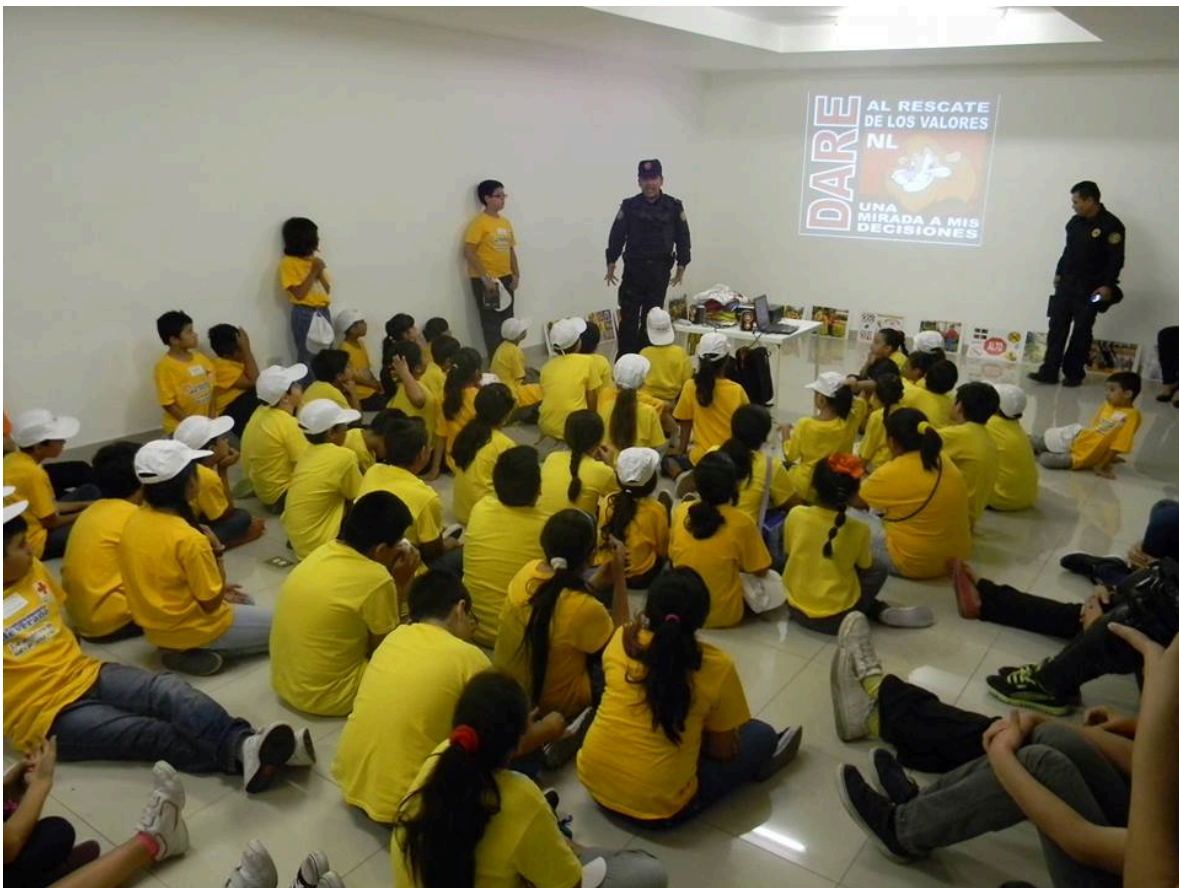
Figura 15.- Labores de proximidad desde la escala básica de educación.

por citar algún ejemplo como fruto de esas labores de proximidad se logró el rescate de menores de edad que estaban siendo víctimas de maltrato infantil y explotación laboral por quienes se supone debieron de haber velado por ellos, fruto de esas platicas vecinales se logró que el ayuntamiento les diera solución de alumbrado público en lugares donde no existía, fruto de esta labor de proximidad han sido las cada vez mejor aceptadas platicas (figura 15) en primarias, secundarias, preparatorias y universidades (figura 16) en donde sin avisar se ha realizado la inspección a mochilas de útiles escolares, retirando de ellas mismas todo que conforme a protocolo no debería estar.