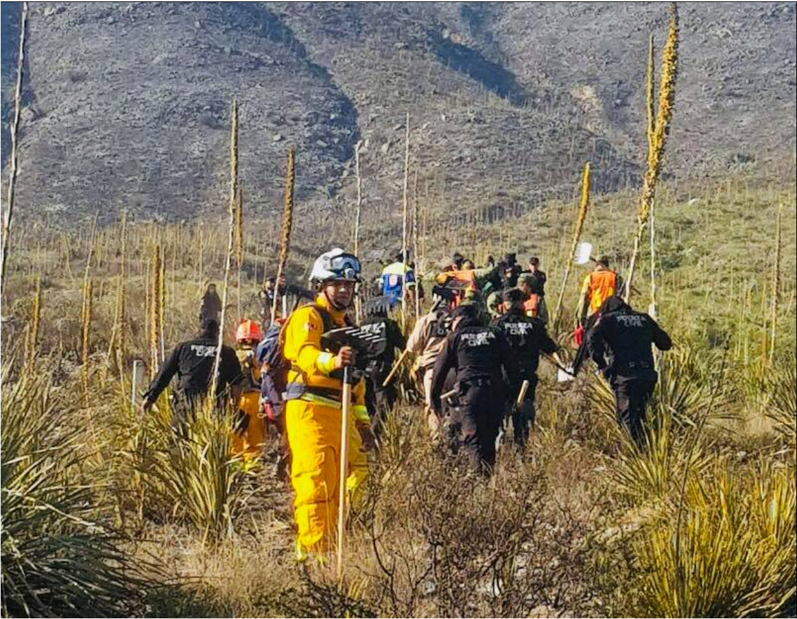
Figura 12.- Labores de búsqueda y localización de personas en un combate de incendio en el Parque la Huasteca, Santa Catarina Nuevo León 2019.

Estas son labores en pro de la seguridad de la ciudadanía; recordemos que por geografía nacional Nuevo León es estado fronterizo en donde me ha tocado la buena ventura de rescatar migrantes que viajaban en condiciones inhumanas dentro de cajas de tráiler .