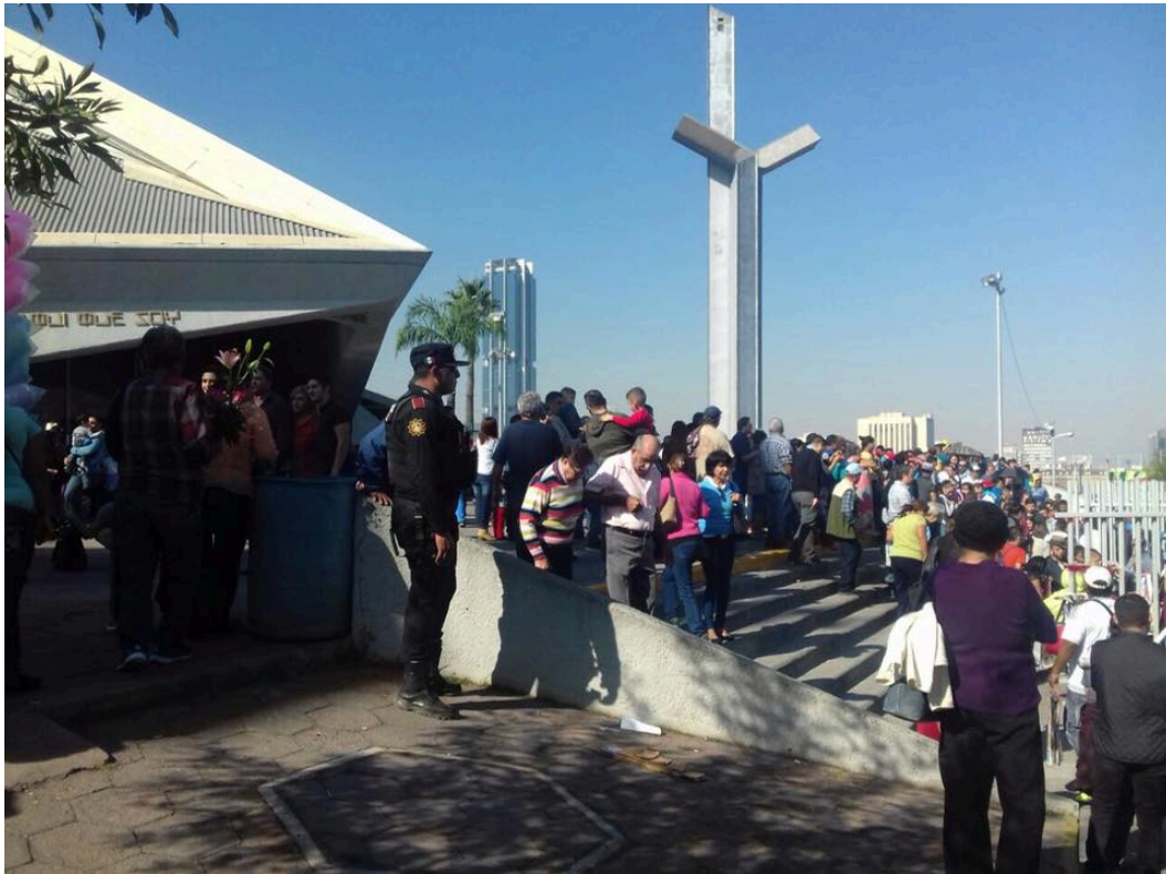
Figura 7.- Operativo semana santa.