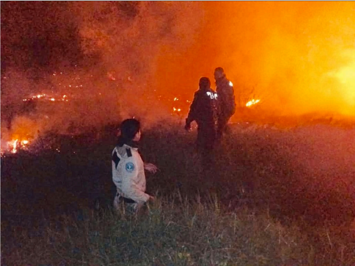
Figura 11.- Combate frontal a incendios.