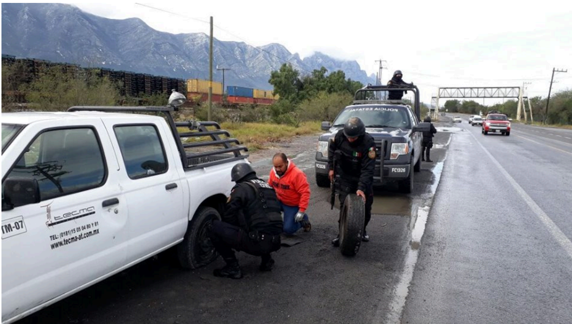
Figura 13.- Operativo Verano Seguro 2017.

Verano Seguro es dar presencia y auxilio en carretera (figura 13) en accidentes vehiculares que por la imprudencia de uno o más conductores tienen resultados de personas lesionadas, algunas de ellas víctimas mortales en el lugar, otras tantas en donde se tiene que aplicar el buen juicio y moral pues ha habido ocasiones en que la ambulancia más cercana está a una o 2 horas de distancia y que nosotros como primer respondiente (recordemos que primer respondiente es aquel que realizando labores de seguridad pública es el primero en llegar a la zona del evento) tenemos la obligación moral de preservar por todos los medios la vida, haciendo uso de nuestras limitantes realizamos todo lo humanamente posible para lograr ese objetivo: la preservación de la vida.